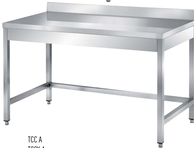
TCC A TCCX A

700 x 700 x 850 H. 800 x 700 x 850 H. 900 x 700 x 850 H. 1000 x 700 x 850 H. 1100 x 700 x 850 H. 1200 x 700 x 850 H. 1300 x 700 x 850 H. 1400 x 700 x 850 H. 1500 x 700 x 850 H. 1600 x 700 x 850 H. 1700 x 700 x 850 H. 1800 x 700 x 850 H. 1900 x 700 x 850 H. 2000 x 700 x 850 H. 2100 x 700 x 850 H. 2200 x 700 x 850 H. 2300 x 700 x 850 H. 2400 x 700 x 850 H. 2500 x 700 x 850 H. 2600 x 700 x 850 H. 2700 x 700 x 850 H. 2800 x 700 x 850 H. 2900 x 700 x 850 H. 3000 x 700 x 850 H.