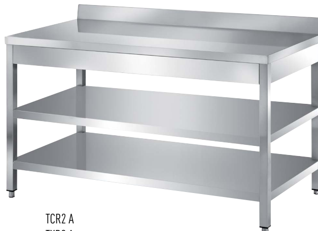
TCR2 A TXR2 A

700 x 700 x 850 H. 800 x 700 x 850 H. 900 x 700 x 850 H. 1000 x 700 x 850 H. 1100 x 700 x 850 H. 1200 x 700 x 850 H. 1300 x 700 x 850 H. 1400 x 700 x 850 H. 1500 x 700 x 850 H. 1600 x 700 x 850 H. 1700 x 700 x 850 H. 1800 x 700 x 850 H. 1900 x 700 x 850 H. 2000 x 700 x 850 H. 2100 x 700 x 850 H. 2200 x 700 x 850 H. 2300 x 700 x 850 H. 2400 x 700 x 850 H. 2500 x 700 x 850 H. 2600 x 700 x 850 H. 2700 x 700 x 850 H. 2800 x 700 x 850 H. 2900 x 700 x 850 H. 3000 x 700 x 850 H.