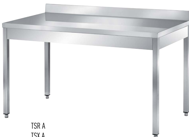
TSR A TSX A