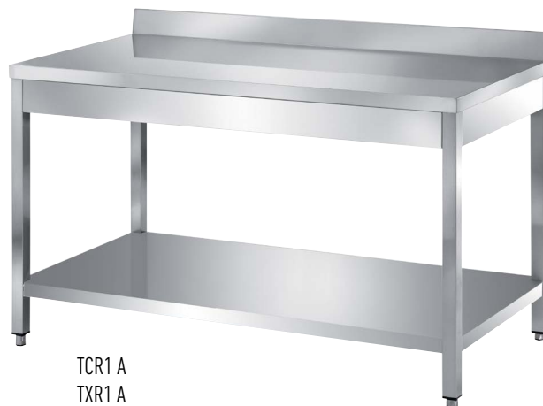
TCR1 A TXR1 A