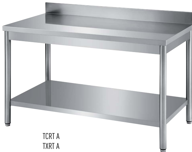
TCRT A TXRT A

Gambe tonde Ø 50x50 mm - Round legs Ø 50x50 mm